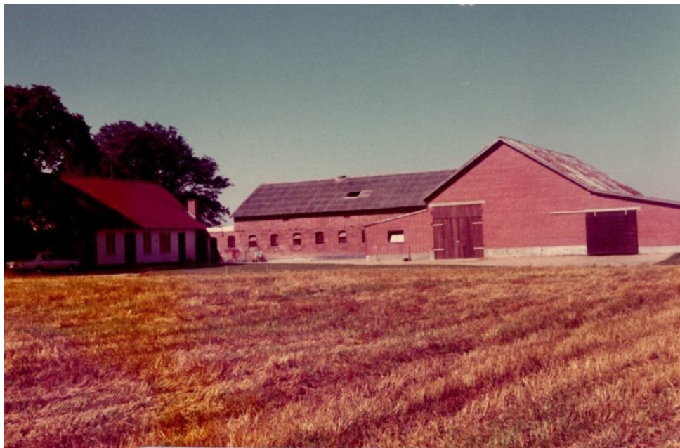
Gl. Præstevej 23 ca. 1980