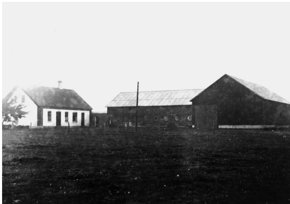
Gl Præstevej 23 ca. 1935